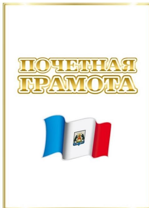
Рисунок 2. Разворот Почетной грамоты Правительства Новгородской области